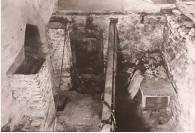
Deler av korkjelleren i Domkirken, der deler av golvet i koret er fjernet. 90