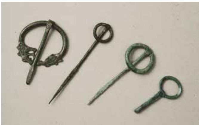
Eksempler på ringnåler fra Rogaland. Fra Torget i Stavanger er bare selve nålene bevart.

Ved arkeologiske undersøkelser på Veøy i Romsdalen har arkeologene påvist to kirkegårder fra vikingtiden. Den eldste er anlagt en gang i første halvdel av 900-tallet, den andre nærmere år 1000. Det har trolig vært en samtidig kirke eller kapell på stedet. 37 Videre viste Per Hernæs til at det er spor etter kristen innflytelse i graver fra yngre jernalder i Rogaland. Det dreier seg dels om graver som mangler klare hedenske tegn (som flatmarkgraver, graver med