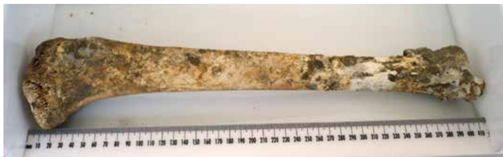
Et lårbein fra Stavanger domkirkes kor.