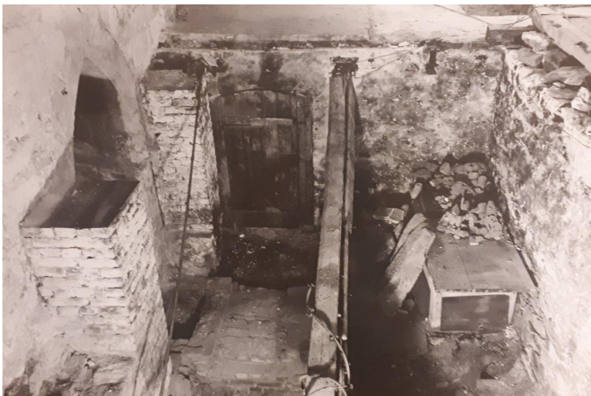
Fig. 1. Parti av korkjelleren i Domkirken ca. 1940.

Domkirken brant en gang mellom sommeren 1271 og sommeren 1272. Etter brannen ble det bygd et nytt kor i gotisk stil. Det gamle koret må ha vært i romansk stil. Det var i 1934 uklarhet og uenighet om hvor stort det romanske koret hadde vært og hvordan det så ut. Det dannet utgangspunktet for utgravingene.