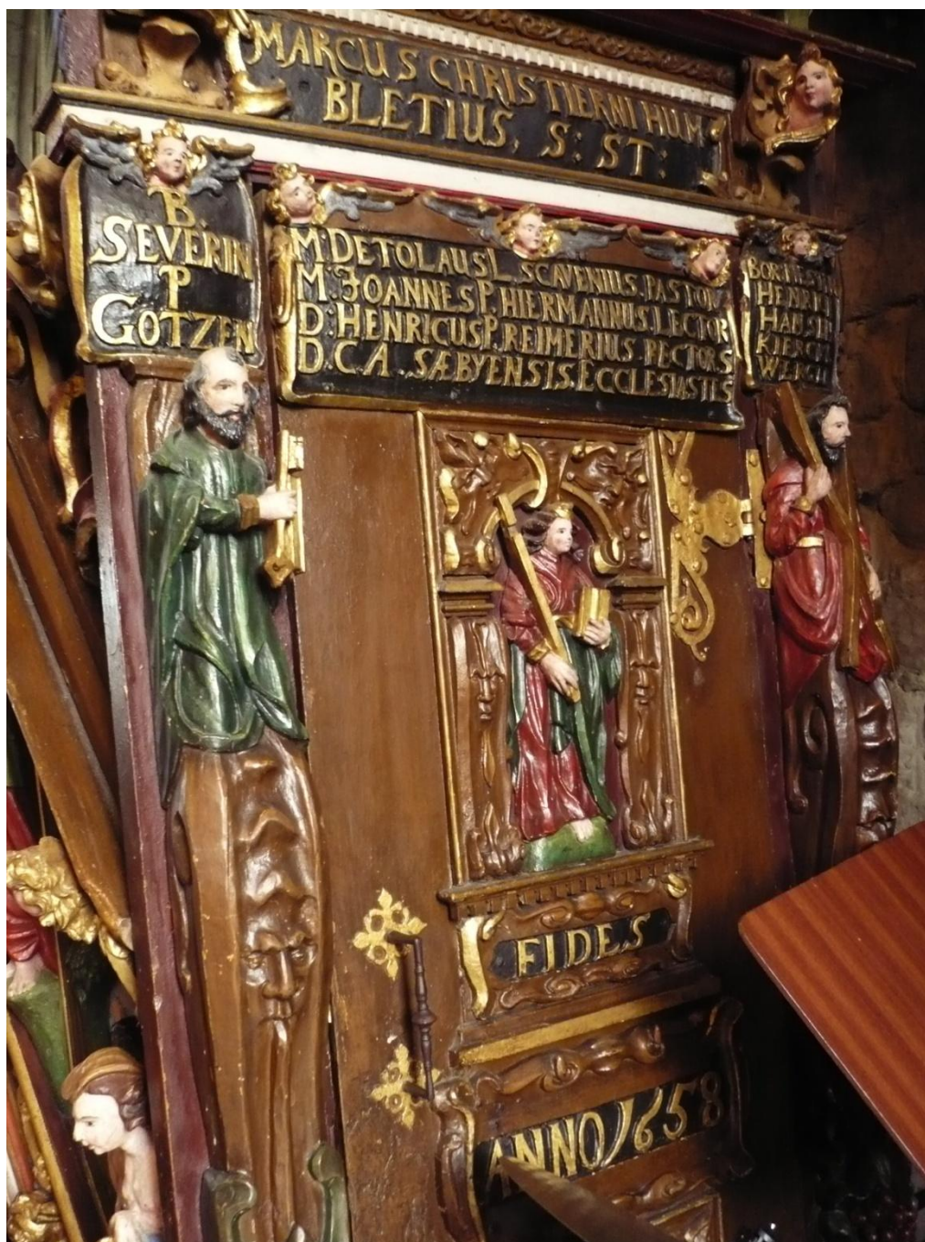
Figur 3: Utsmykkinger fra prekestolen fra 1658.

I Sideskiberne nedre Ender under de nederste Vinduer har formodentlig i den Katholske Tid staaet Altere for en eller anden Helgen. Skibet oplyses forresten af spisbuede Vinduer høit oppe, over Sideskibenes Tag.