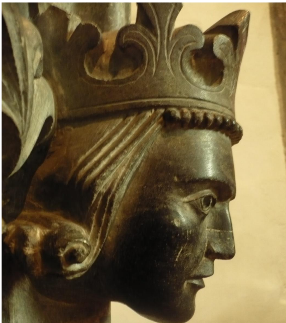
Figur 2: Kong Erik Magnusson ved nordre sakrestidør.